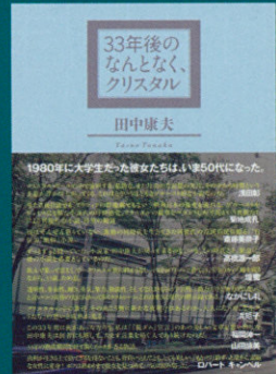
『33年後のなんとなく、クリスタル』 (河出書房新社) ¥1,600

AORの100枚の名盤を、朝、午後、夕方、夜のシーンに分けてエッセイのかたちで80年代ライフスタイルとして描く。ジャズ・ミュージシャン/文筆家の菊地成孔が絶賛。古書市場で高値をつける「伝説の書」だったが、2015年5月に復刻された