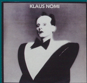
Klaus Nomi / Klaus Nomi より "cold Song"