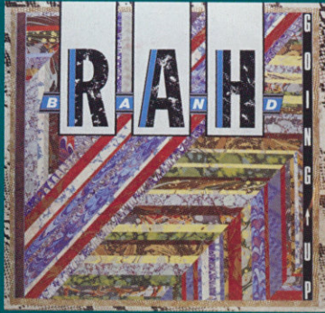
The RAH Band / Going Up より "Perfumed Garden"