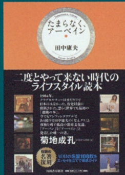
『たまたなく、アーベイン』 (河出書房新社) ¥2,600

AORの100枚の名盤を、朝、午後、夕方、夜のシーンに分けてエッセイのかたちで80年代ライフスタイルとして描く。ジャズ・ミュージシャン/文筆家の菊地成孔が絶賛。古書市場で高値をつける「伝説の書」だったが、2015年5月に復刻された