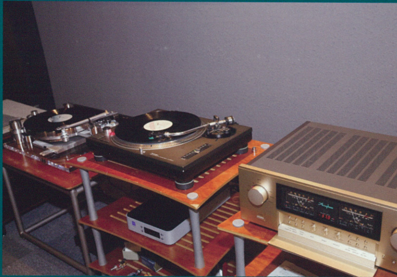
テクニクス SL-1200 とオラクル・テلفィ。フォノイコライザーには PS オーディオの NuWave Phono Converter。A/D コンバーターを内蔵していて、レコード音源をハイレゾ・デジタルファイルに変換できる PS オーディオ 〓 完美電気サポートセンター ☎ 050(3388)6838